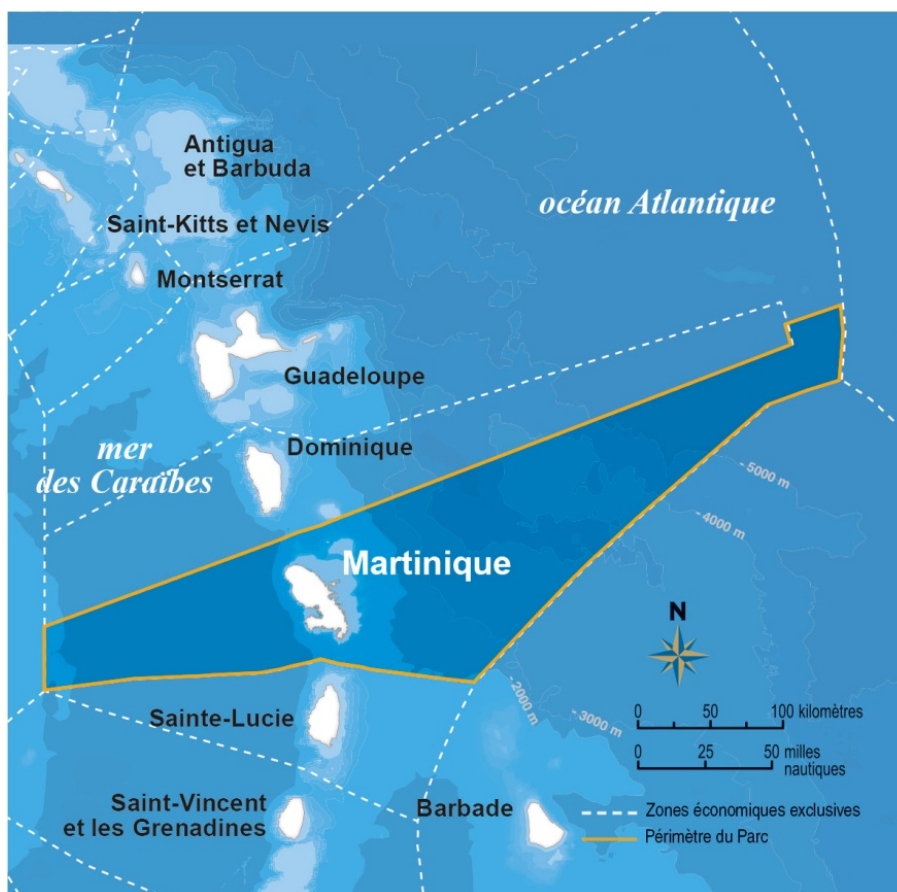
Carte du périmètre du Parc naturel marin de Martinique

Créé par décret le 5 mai 2017, le Parc naturel marin de Martinique s'étend de la côte martiniquaise jusqu'à la limite extérieure de la zone économique exclusive pour une superficie de 47 340 km 2 .